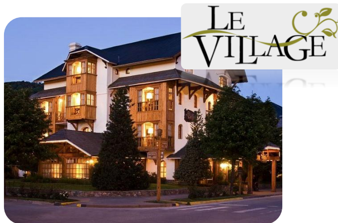
HOTEL LE VILLAGE