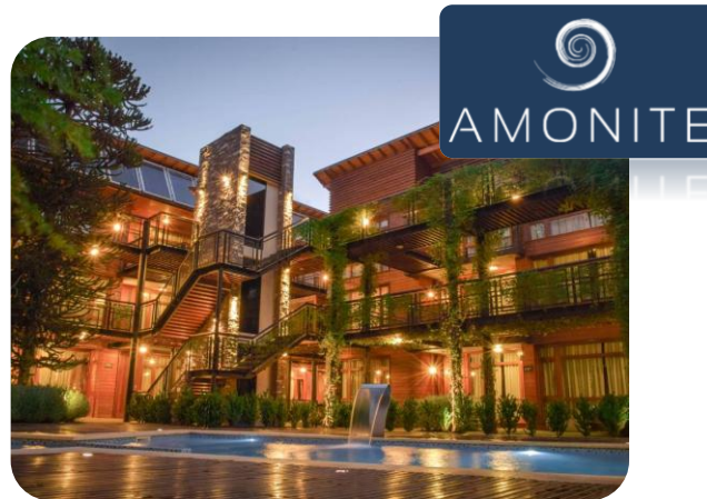
APART HOTEL AMONITE