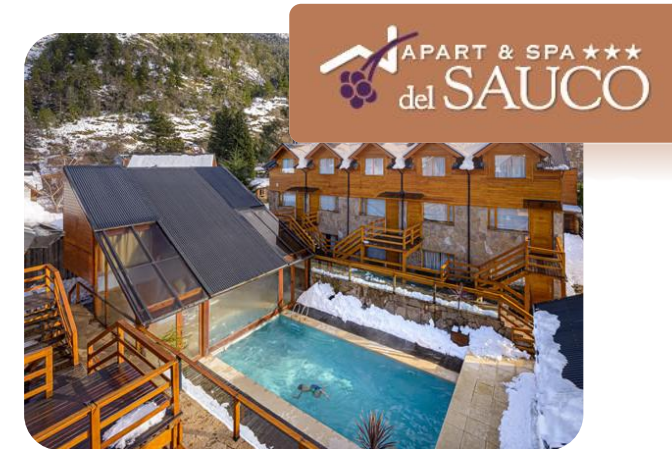
HOTEL DEL SAUCO